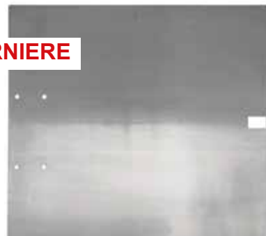
ALU – DECKEL mit V2A SCHARNIERE